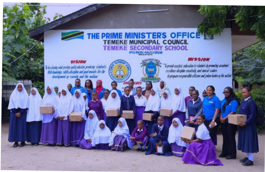
Alhamisi Machi 05, 2026, Dar es salaam: Watumishi wanawake wa HESLB katika picha ya pamoja na wanafunzi wa kike baada ya kutembelea na kugawa taulo za kike kwa wanafunzi wa kike katika Shule ya Sekondari Temeke. Tukio hili lilikuwa ni sehemu ya maandalizi kuelekea maadhimisho ya Siku ya Wanawake Duniani, Machi 08, 2026.