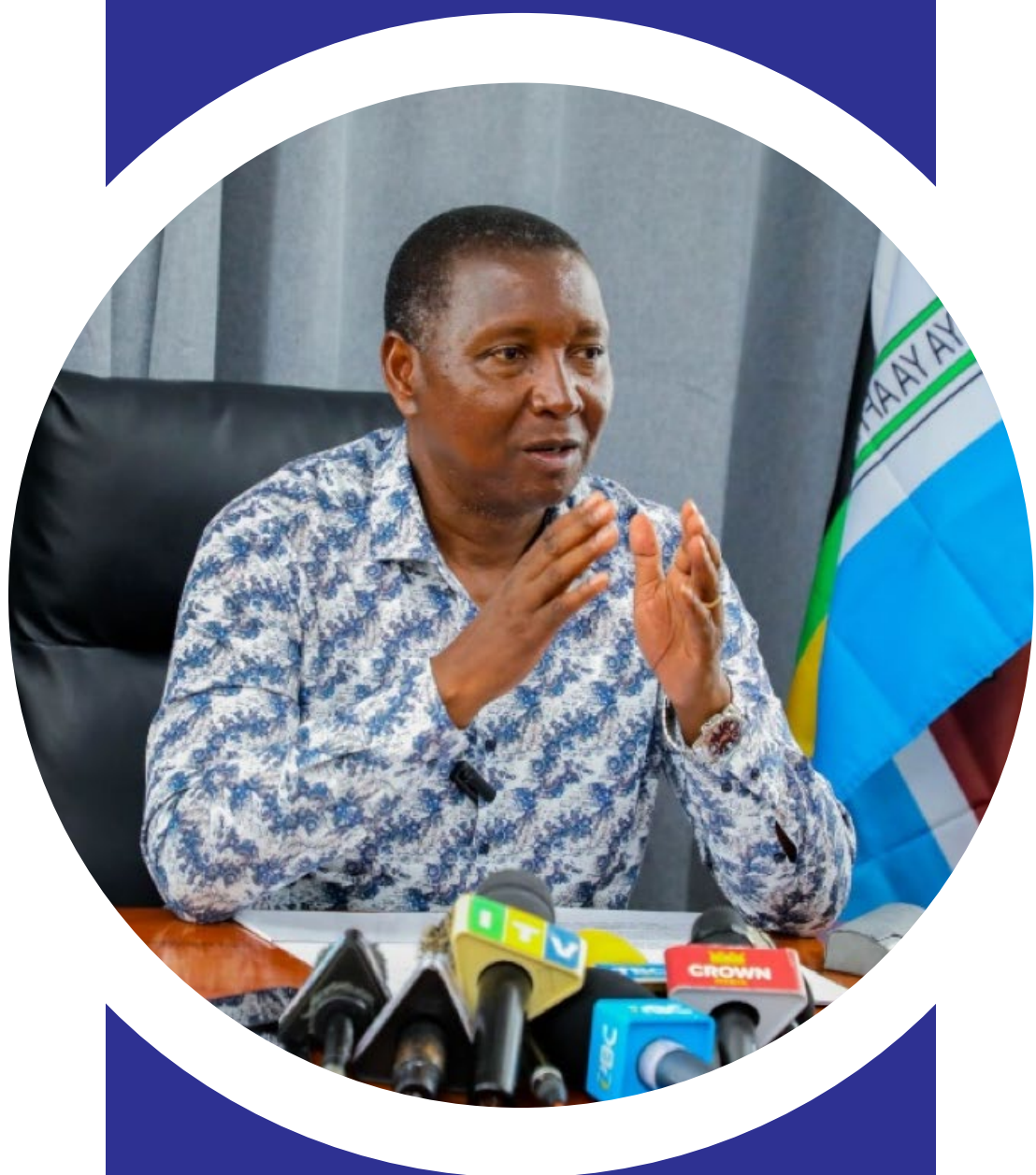
Adolf Mkenda Waziri wa Elimu, Sayansi na Teknolojia